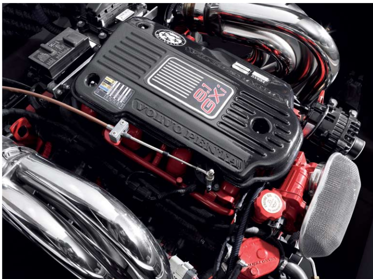
Cantiere Nautico Feltrinelli Tuning III