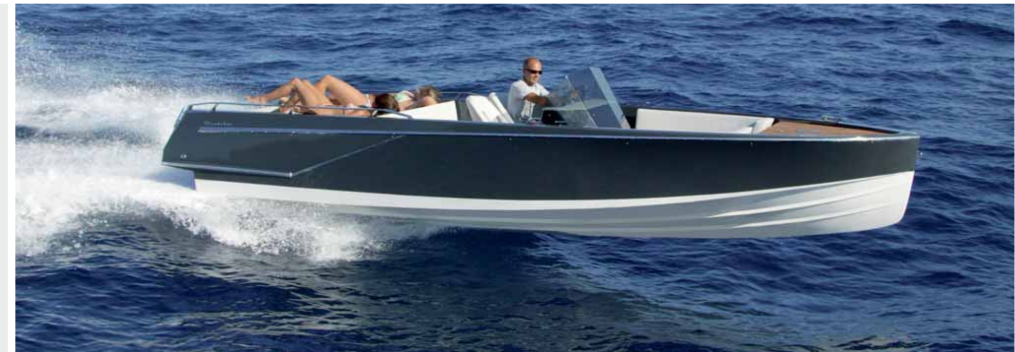
FRAUSCHER 686 LIDO – STILVOLLE MODERNE

Tel. +43 7612 63655 - 0 Fax +43 7612 63655 - 11 frauscher@bootswerft.at www.frauscherboats.com