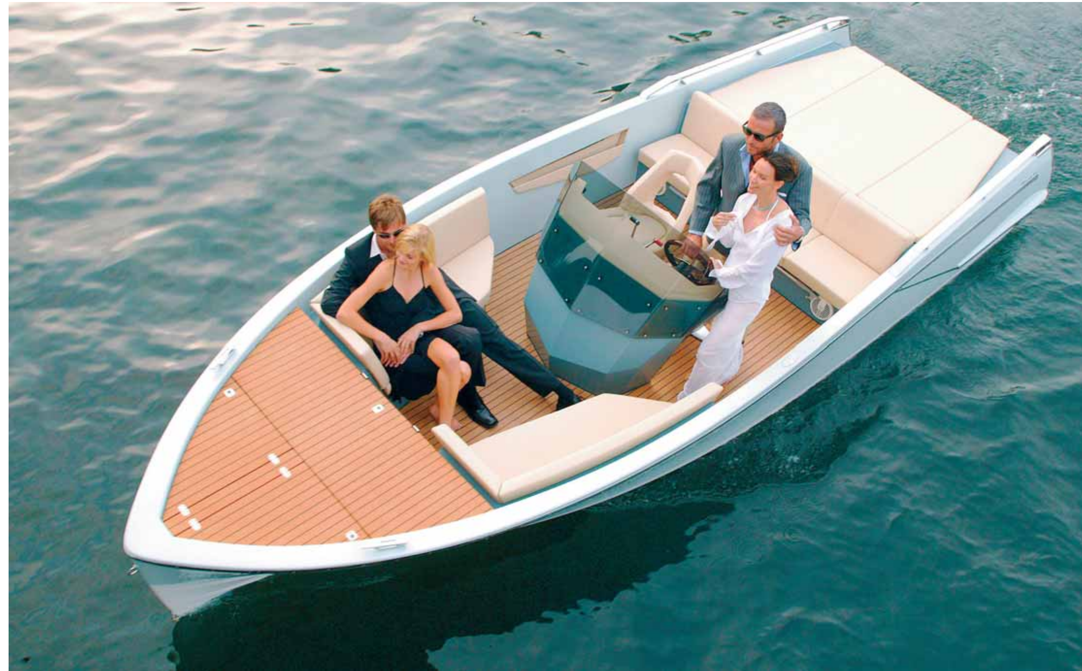
> ZEIT ZUM TRÄUMEN