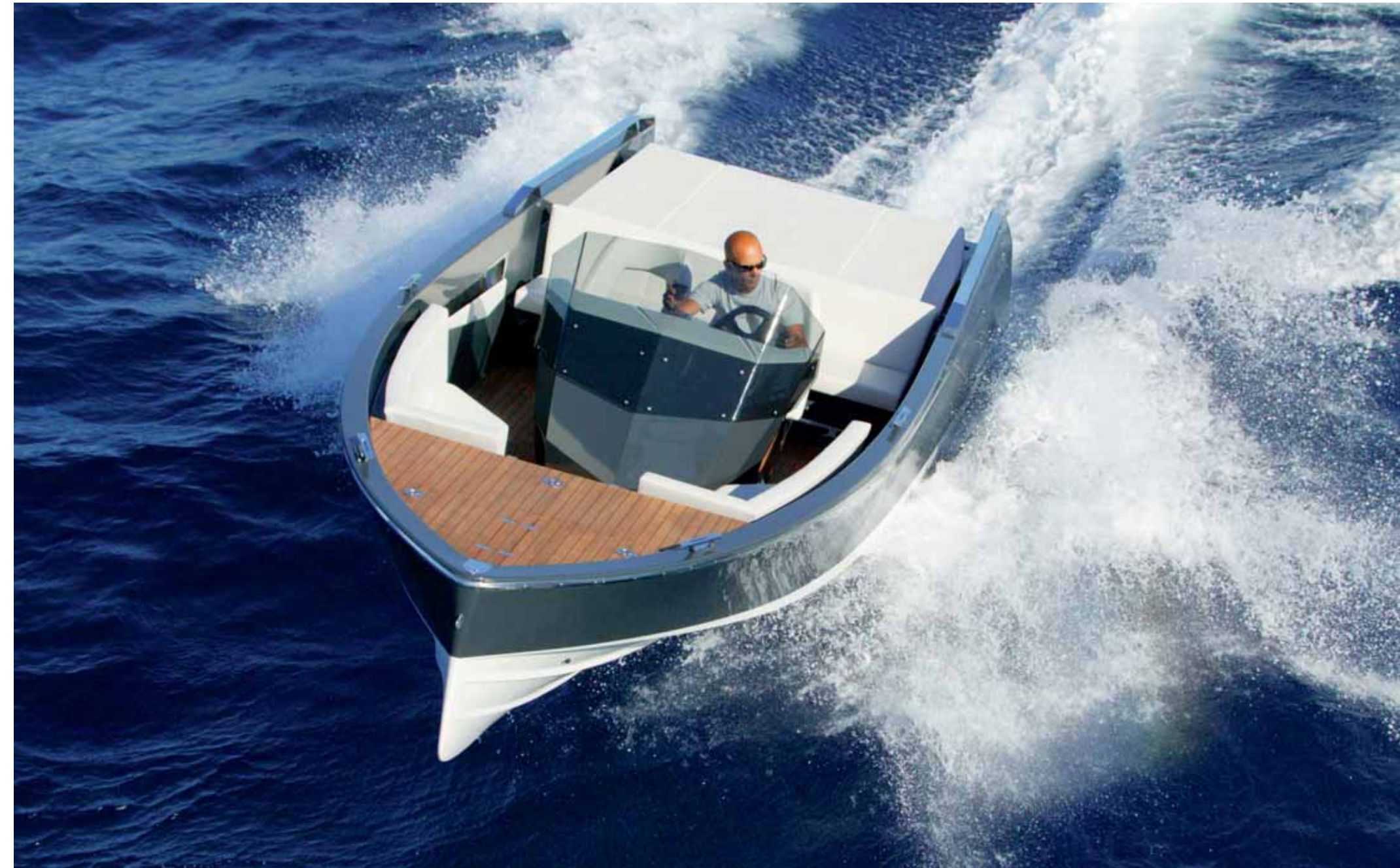
> EXTRAVAGANZ DURCH DESIGN