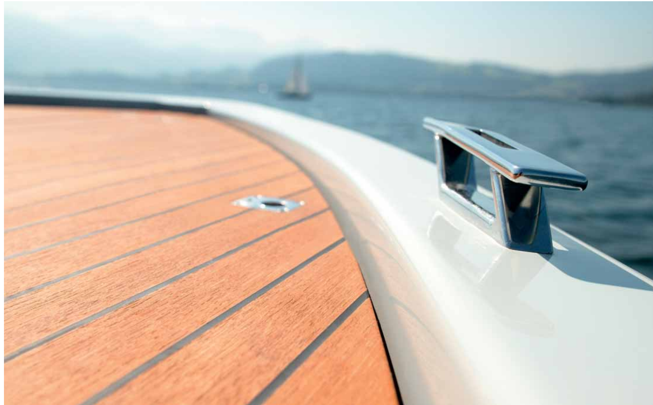
> BLEIBENDER EINDRUCK