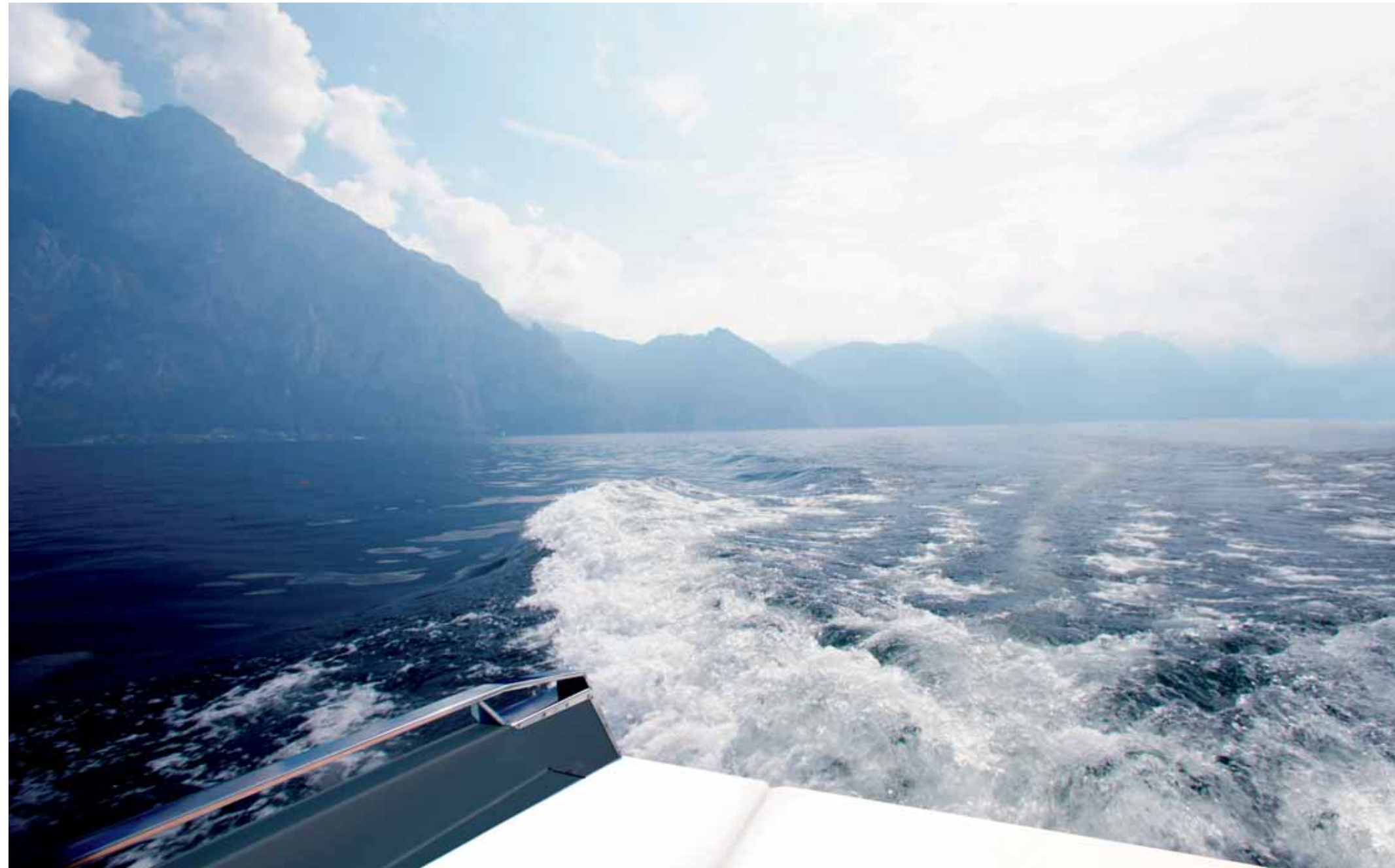
> AUSSICHT GENIESSEN