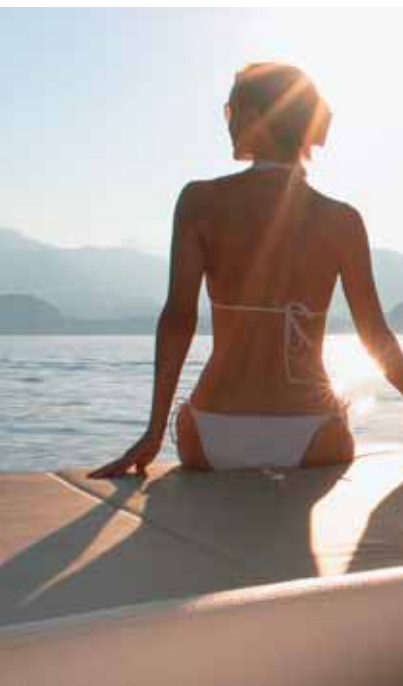
^ FRAUSCHER 686 LIDO