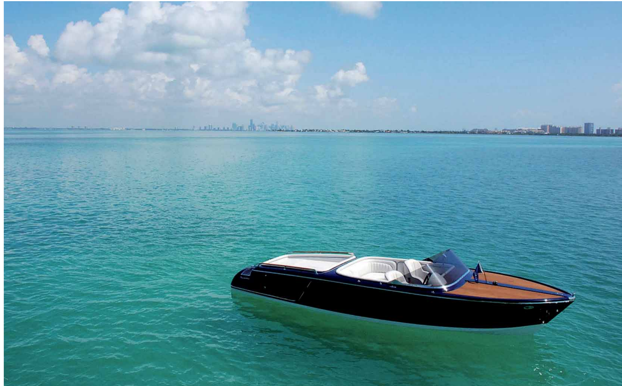
> PERFEKTE PERSPEKTIVEN