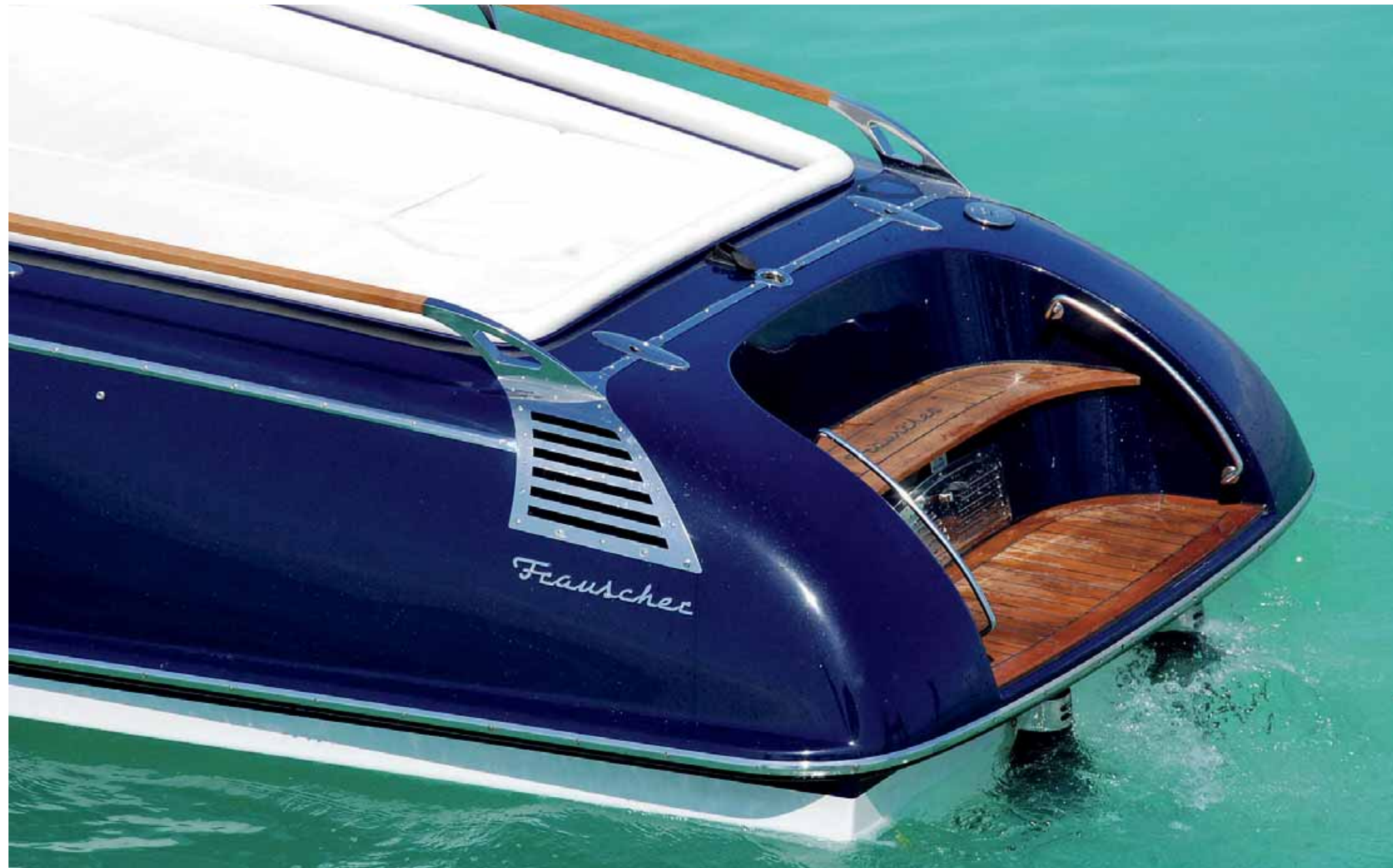
> ELEGANTES FINISHING