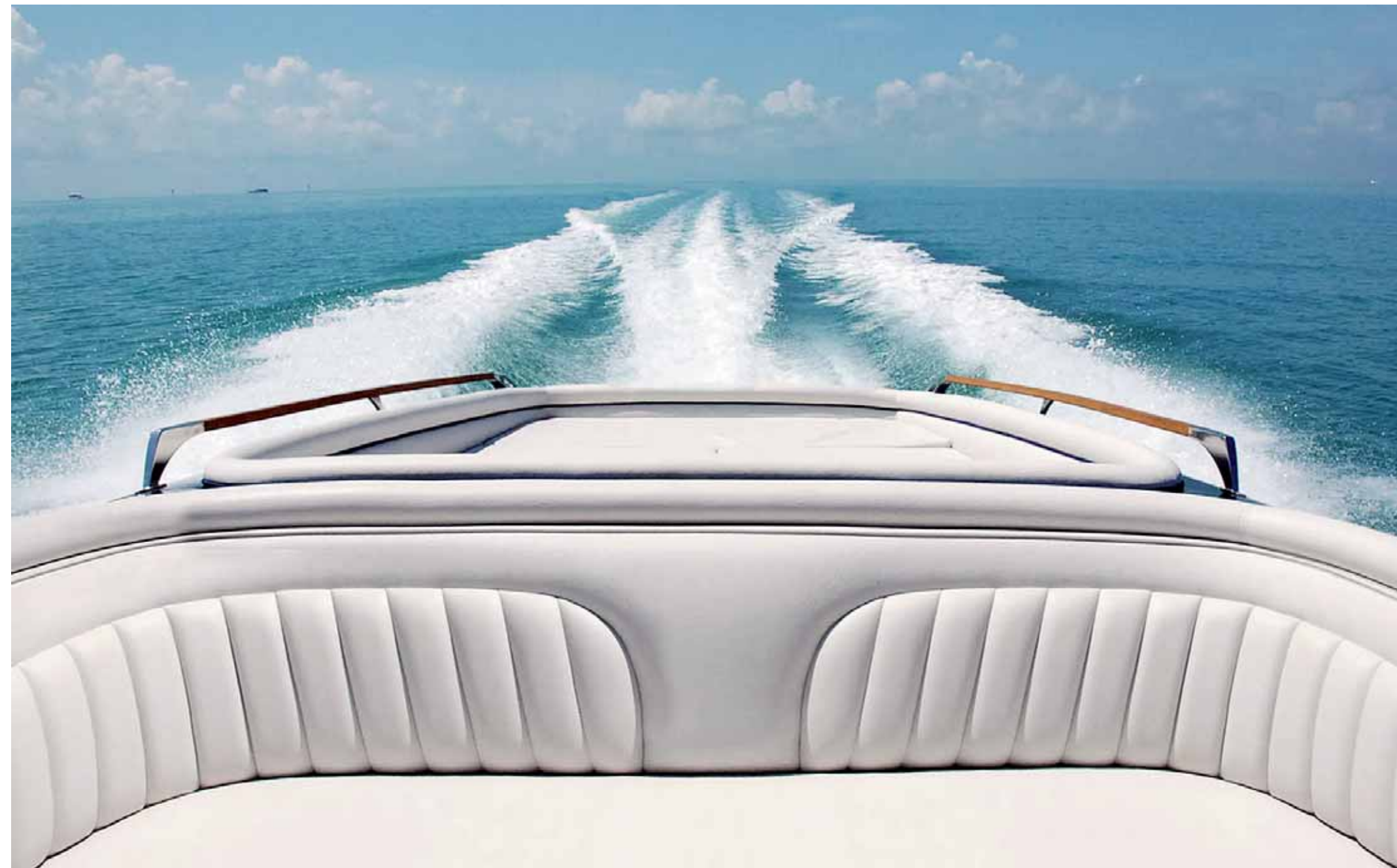
> SCHÖNE AUSSICHTEN