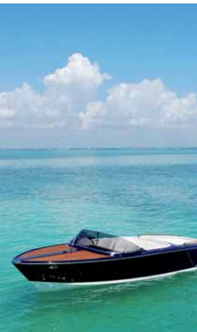
^ FRAUSCHER 757 ST. TROPEZ

Frauscher Bootswerft GmbH & Co KG Traunsteinstraße 10 – 14 4810 Gmunden Austria / Europe