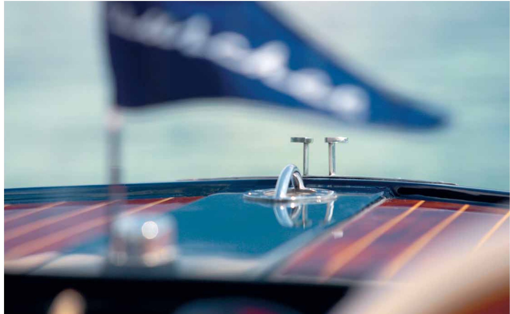
> VERSPIELTES DESIGN