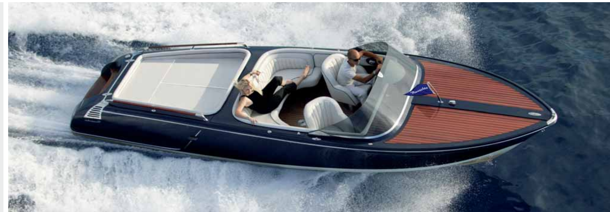
FRAUSCHER 757 ST. TROPEZ - KLASSISCHE LINIEN, MODERNE TECHNIK